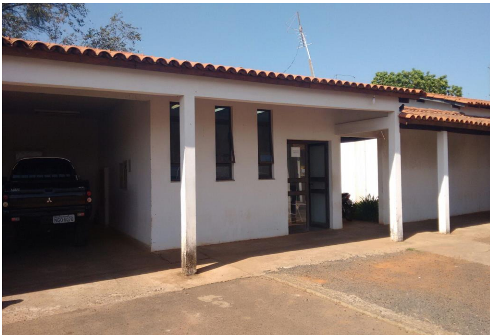
FIGURA 03: Salas do Pelotão

Reforma Prevista: Área de vivência e alojamento Samu