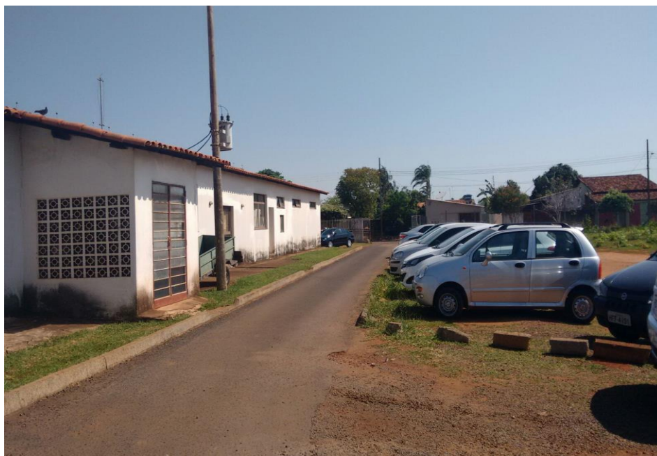
FIGURA 04: Área externa