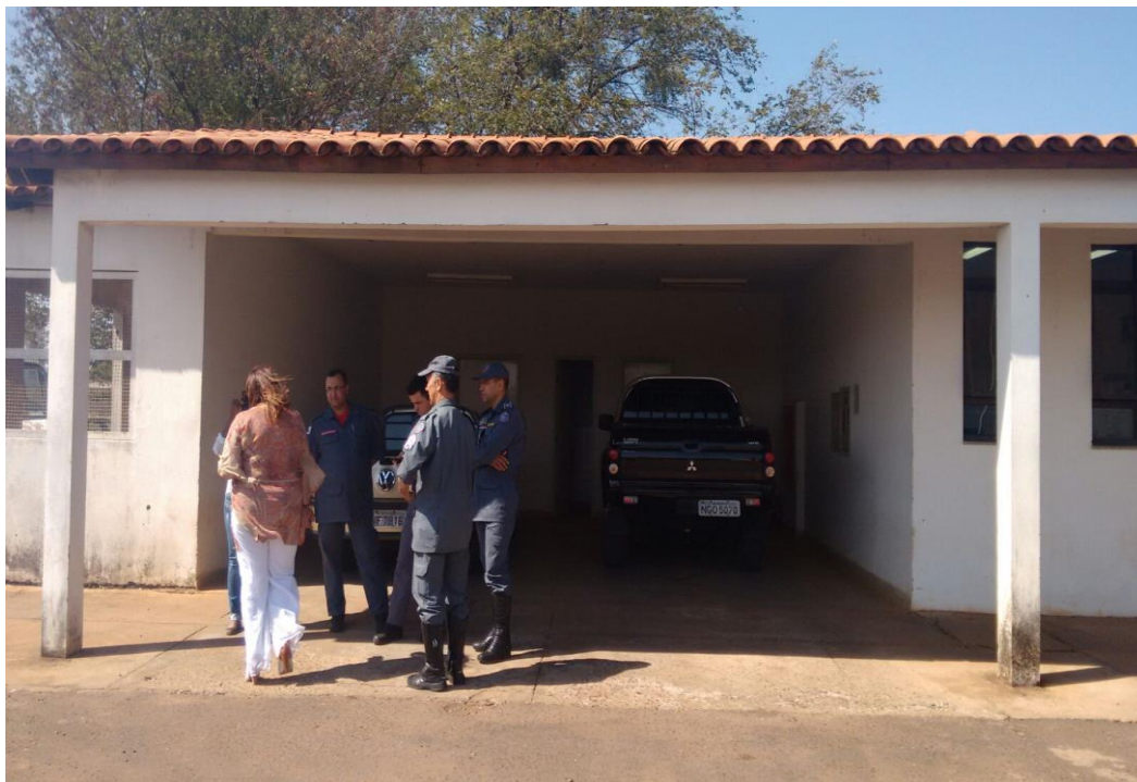
FIGURA 02: Fachada da Edificação

Reforma Prevista: Pintura e adaptação para mídia e disposição de vaga para ambulância.